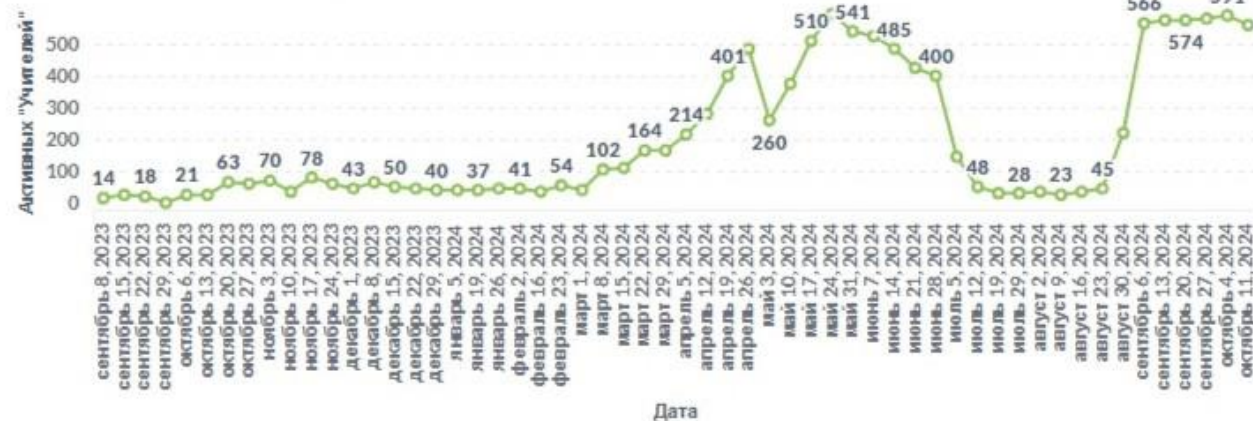
Динамика активности СПО подведов КО